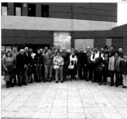
► Participants en una edició anterior.

Les trobades estan organitzades per l'Àmbit de Recerques del Berguedà, els Amics de Besalú i el seu Comtat, el Centre d'Estudis Comarcals del Ripollès, el Centre d'Estudis Ribagorçans, l'Ecomuseu de les Valls d'Àneu, l'Institut