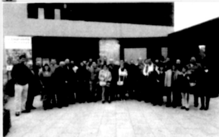
Imatge d'arxiu dels participants en l'anterior edició de les Trobades.