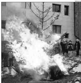
La crema del mai, una de les tradicions de Canillo.

En el seu text, Bascompte explica que a Canillo hi ha dues festes d'interès cultural nacional: els arlequins del Carnaval i la Fira del bestiar. Els arlequins són "l'element dinamitzador de les festes de Carnaval a Cani-