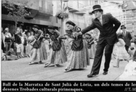
Ball de la Marratxa de Sant Julià de Lòria, un dels temes de les desenes Trobades culturals pirinenques. // T. M.

A més dels ponents presencials, també hi col·laboren altres estudiosos del patrimoni festiu andorrà, que enviaran a la SAC el seu text perquè sigui inclòs en la